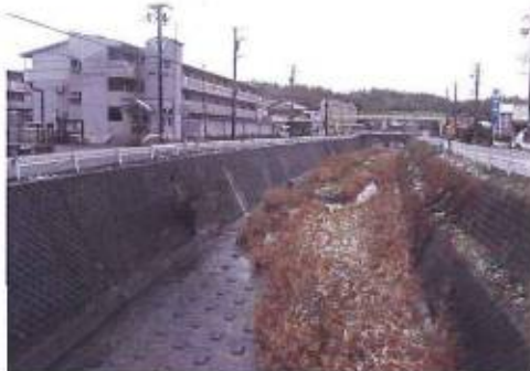
7月25日、突然水位が上がった状況